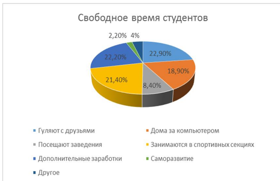
Рис. 2 Опрос студентов о проведении свободного времени в 2019 году

Данные опроса, представленные в таблице 1 показывают, что стали в процентном соотношении уменьшаться две категории: гуляют с друзьями и посещают заведения. Положительные изменения произошли в категории «занимаются спортивных секциях», что свидетельствует о положительном влиянии спортивного клуба университета на досуговую деятельность студентов.