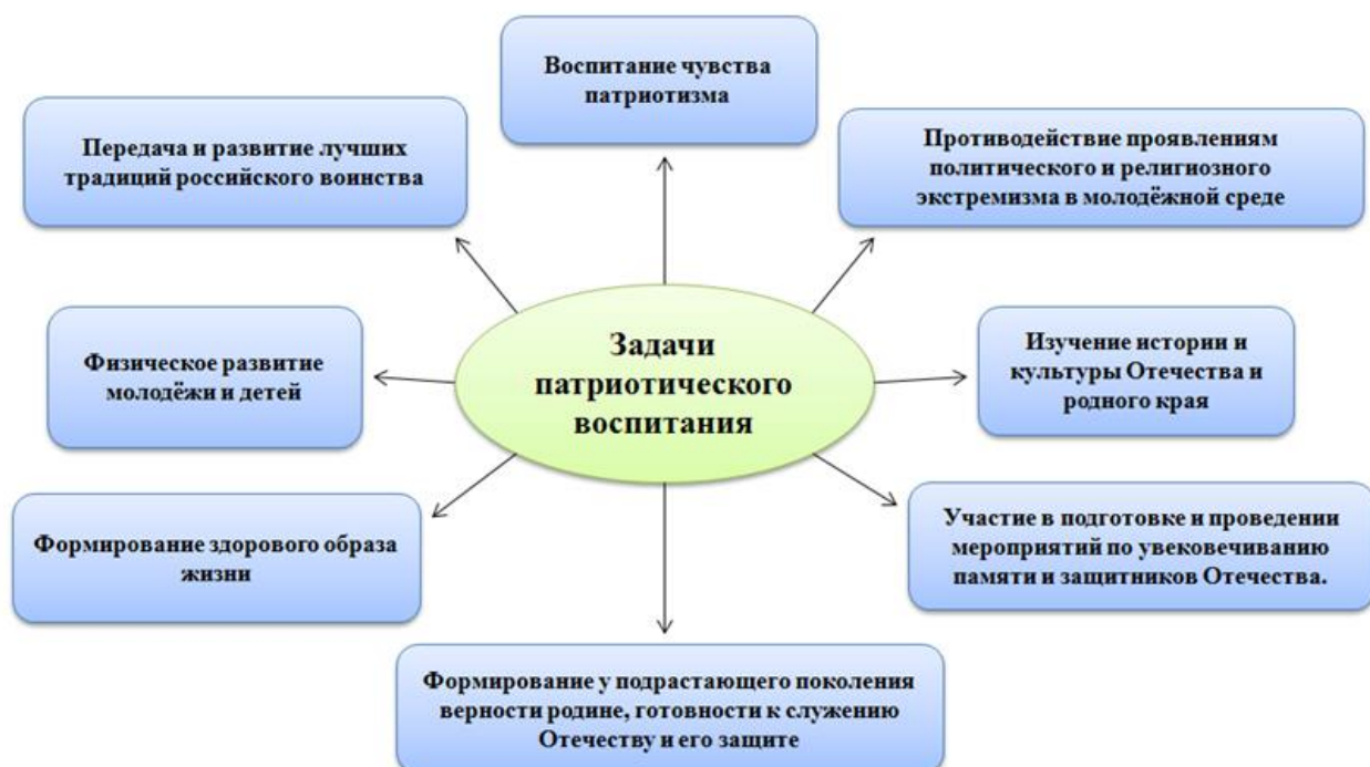
Рис. 3. Задачи патриотического воспитания

Основополагающие принципы патриотического воспитания: научность; гуманизм; демократизм; приоритетность исторического и культурного наследия, системность; преемственность и непрерывность в развитии молодежи; многообразие форм, методов и средств; индивидуальный подход [2].